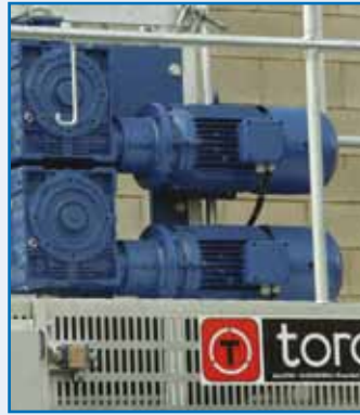
Grupo motriz: motorreductores con electrofreno integrado

Drive unit: gearmotors with built-in electric brake