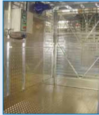
Interior de la cabina

Drive unit: gearmotors with built-in electric brake