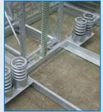
Muelles amortiguadores de seguridad